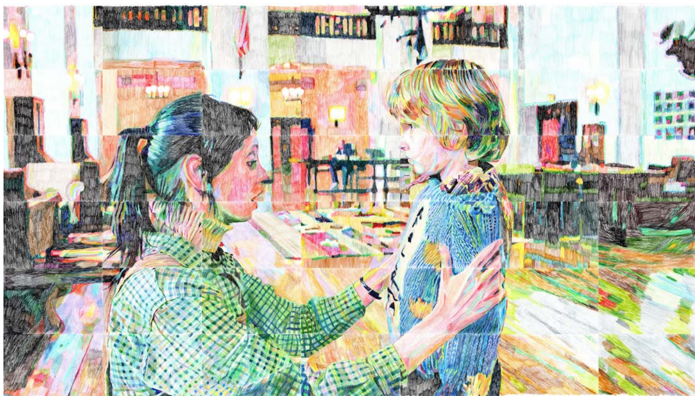
Cécile Bicler, TAZ (Zone Autonome Temporaire) #08 , 2022 Crayons de couleur et pastels 108 x 189 cm (42 feuilles de format 18 x 27 cm)