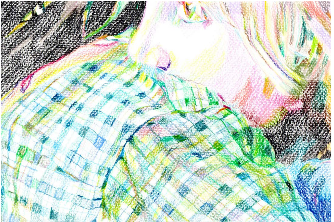
Cécile Bicler, TAZ (Zone Autonome Temporaire) #16 (extrait) , 2022 Crayons de couleur et pastels Une des 42 feuilles de format 18 x 27cm du dessin puzzle